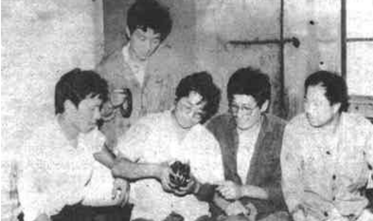
本版责任编辑 杨荣寅

同时，他们还投资10万余元，对基层门市、仓库、会计室等重点部位加固改造，加大防范措施，避免了治安案件、刑事案件和治安灾害事故的发生，保障了企业的正常经营。（韩广荣）