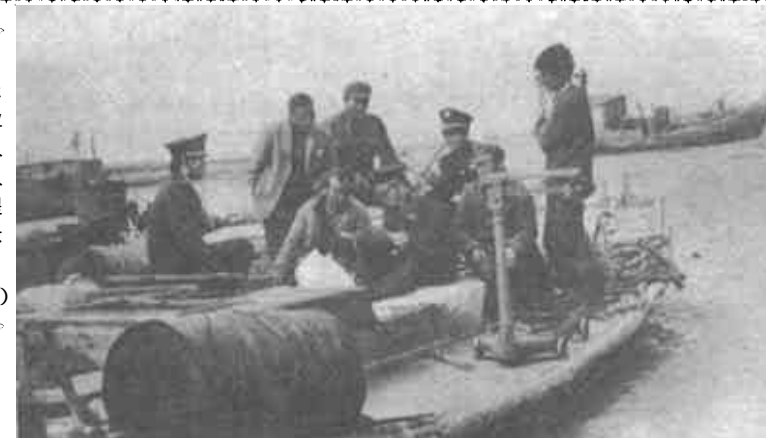
河口区税务局坚持优质服务，情暖业户。图为该局税务人员深入边崖海面为人民群众和纳税业户提供生产、商品和技术服务，深受欢迎。