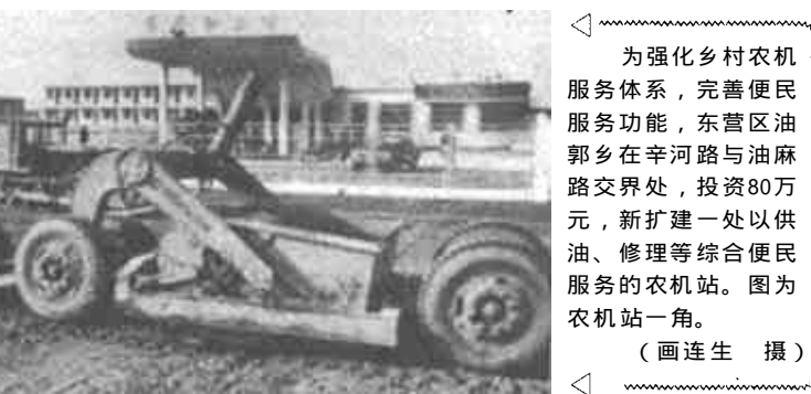
为强化乡村农机服务体系，完善便民服务功能，东营区油郭乡在辛河路与油麻路交界处，投资80万元，新扩建一处以供油、修理等综合便民服务的农机站。图为农机站一角。